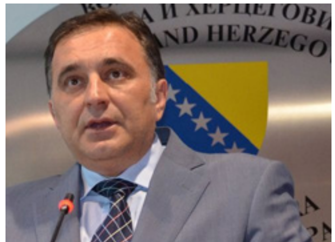
Damir Ljubić, ministar za ljudska prava i izbjeglice Bosne i Hercegovine

Prvi potprojekat u okviru RSP provodiće se u sljedećim gradovima i općinama Federacije Bosne i Hercegovine: Bosanskom Petrovcu, Bosanskom Grahovu, Bugojnu, Dobretićima, Foči u FBiH, Goraždu, Hadžićima, Starom gradu Sarajevu i Vogošći, Olovu, Sanskom Mostu, Travniku i Tuzli, kao i u sljedećim gradovima i općinama u Republici Srpskoj: Banja Luci, Brodu, Derventi, Gradiški, Foči, Novom Goraždu, Prijedoru, Srebrenici i Trebinju.