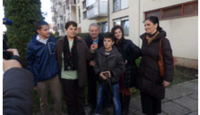
Porodica u Petrinji ispred svog novog stana